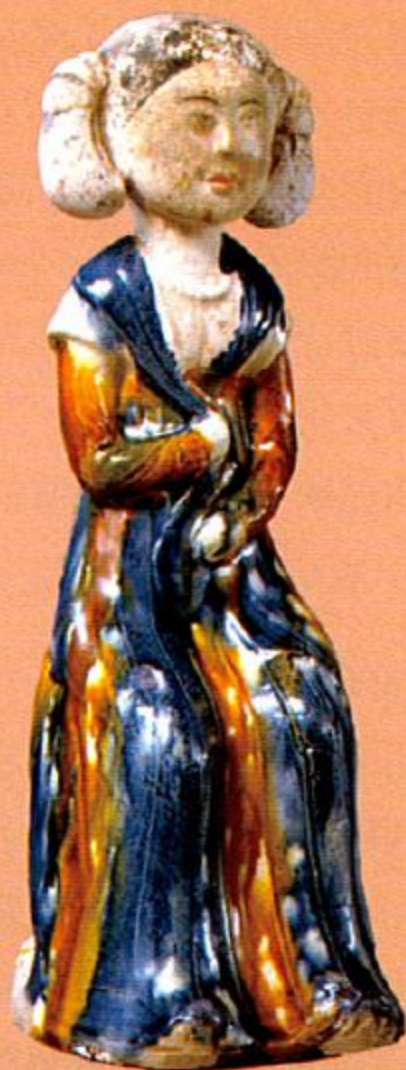
上 唐朝〈三彩藍袖女俑〉。 下 漢朝〈綠袖六博局戲陶俑〉。